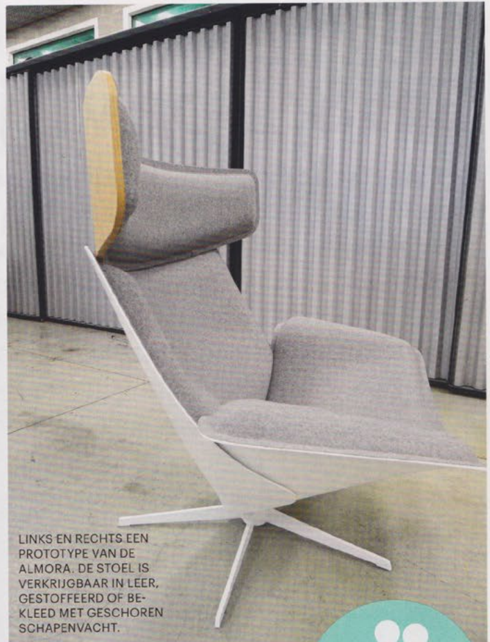
LINKS EN RECHTS EEN PROTOTYPE VAN DE ALMORA. DE STOEL IS VERKRIJGBAAR IN LEER, GESTOFFEERD OF BEKLEED MET GESCHOREN SCHAPENVACHT.